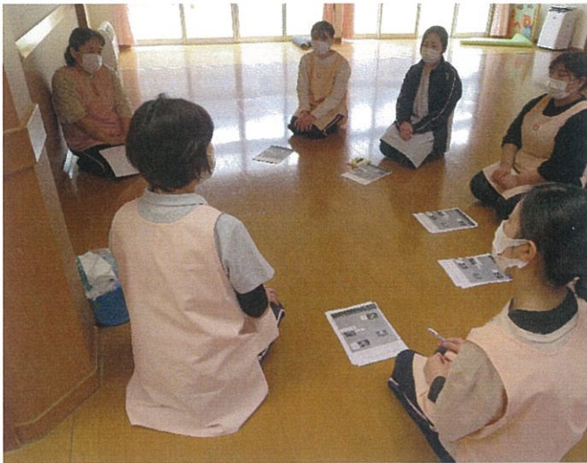
～嘔吐処理等の基本研修の様子～