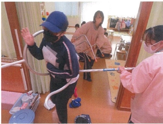
～刺股を使用した不審者訓練～