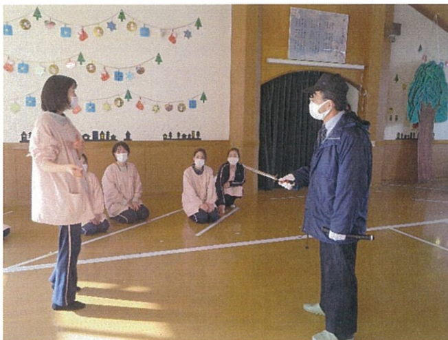
～警察の方から講習を受ける様子～