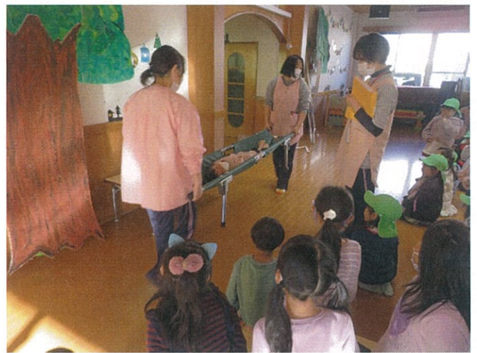
～負傷者の搬送訓練～