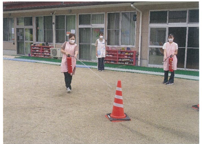
～水消火器で消化練習～